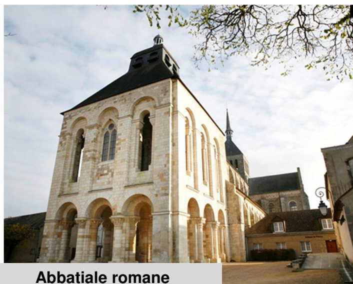
Abbatiale romane Saint-Benoît-sur-Loire