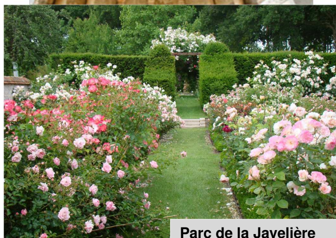
Parc de la Javelière