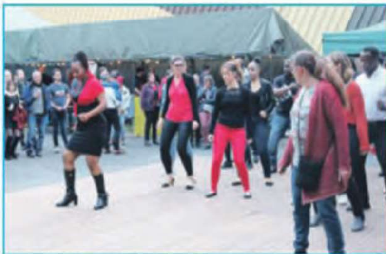
Des démonstrations par la section danse de l'ASCO.